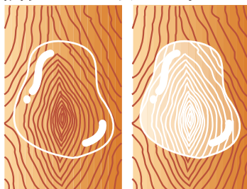
スポーツセーフティー