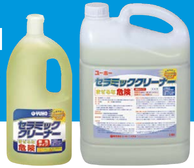
(1ケース：10×12本) (1ケース：50×4本)