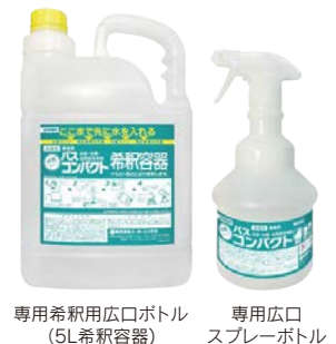
専用希釈用広口ボトル (5L希釈容器)